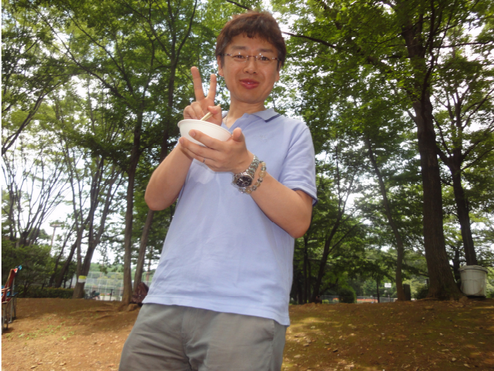
まだ元気なころ・・・