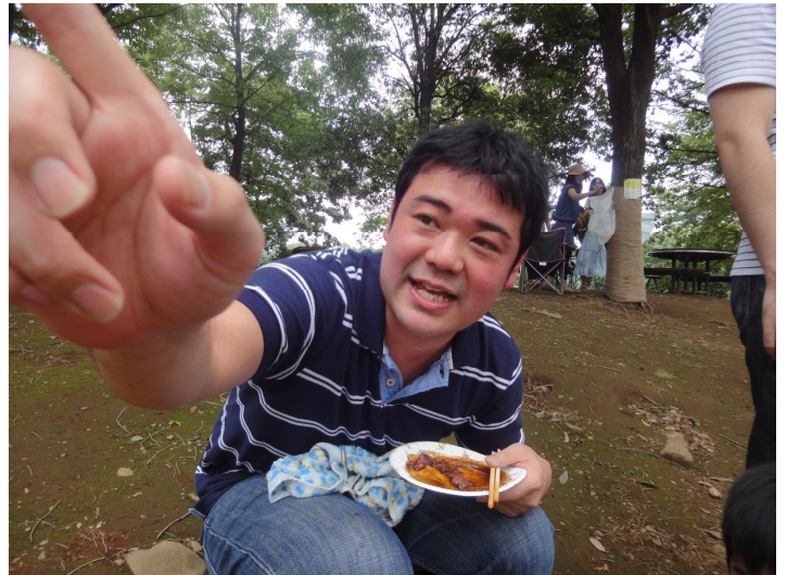
ほろ酔いになっちゃったころ・・・